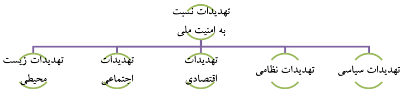
شکل ۳- تهدیدات علیه امنیت ملی (رحیمی، ۱۳۹۷: ۳۶)

باری بوزان تهدیدات امنیتی را در پنج بعد مورد بررسی قرار داده است. این ابعاد عبارتند از: