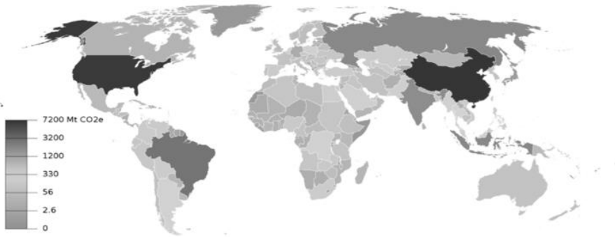
تصویر شماره ۳. نقشه انتشار دی‌اکسید کربن در سال ۲۰۱۹ (edgar, 2019)

و چین - دو کشوری که با رنگ آبی و قرمز مشخص شده‌اند بیشترین تولید گازهای گلخانه‌ای را داشته و تفاوت این دو کشور با سایرین محسوس است.